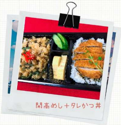
開高めし+タレかつ丼