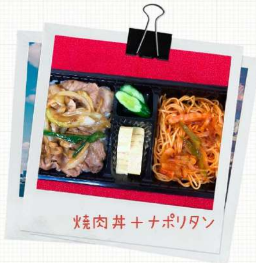
焼肉丼+ナポリタン