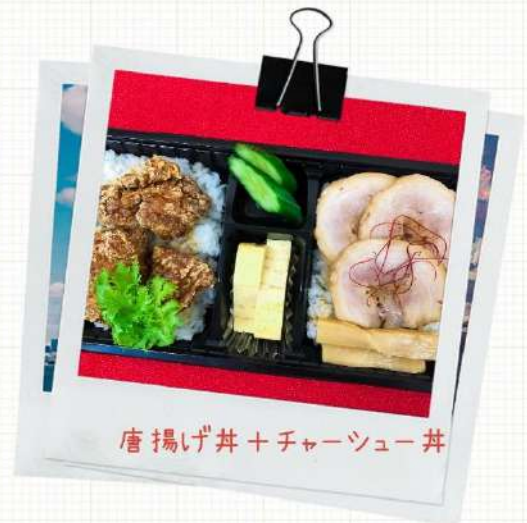
唐揚げ丼+チャーシュー丼